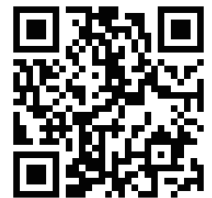
事前申し込み QRコード