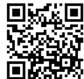
事前申し込み QRコード