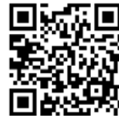
事前申込み QRコード