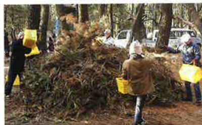
枯れ枝・松ぼっくりひろい

準備は、活動できる服装、タオル、水だけでOK。 ※道具の貸出し・活動のサポート・ボランティア保険加入・ゴミの回収は、KANNEで行います。