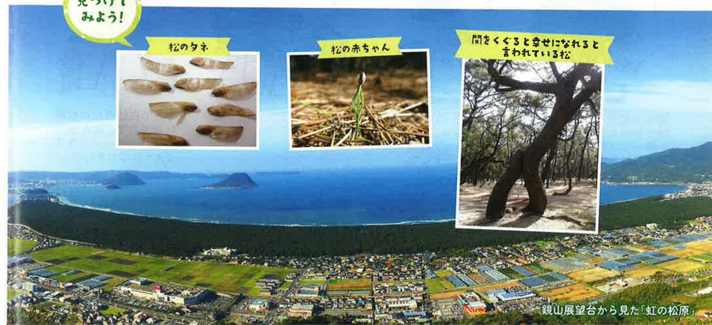
鏡山展望台から見た「虹の松原」