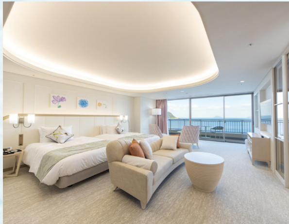
東館/ラグジュアリーツイン 62㎡