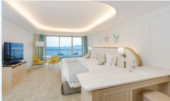
東館/デラックスツイン 51㎡