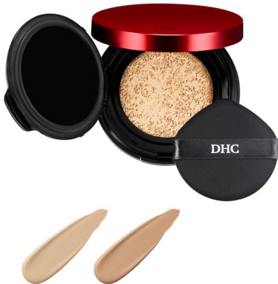
ライトオークル (やや明るい色) ミディアムオークル (自然な明るさの肌色)

スキンケアとメイクアップを両立し、毎日のメイク時間を、肌を整える時間へと導きます。