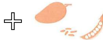
パーソナル成分 3~7 種類

すべてのオーダーに一律で、健康の基本となるビタミン 11 種類をバランスよく配合します。