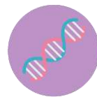
遺伝子検査結果 (未来の様々な健康リスク)