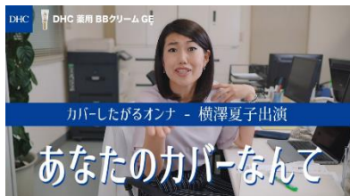
「カバーしたがるオンナ」篇 56秒