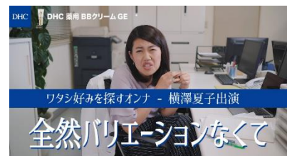
「ワタシ好みを探すオンナ」篇 50秒