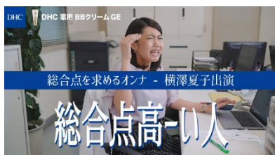
「総合点を求めるオンナ」篇 102秒