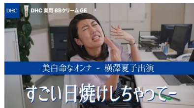
「美白命なオンナ」篇 60秒