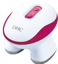
DHC ボディエキスパート

※1：顔への使用は推奨しておりません。使用前に取扱説明書の注意事項をご確認ください ※2：電池は同梱されておりませんので、別途、量販店等でお買い求めください ※3：DHC調べ