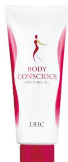
DHC ボディコンシャス ジェルスムーザー