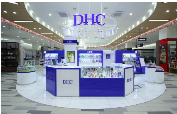
DHC 免税店 DOTON PLAZA 大阪

DHC は 2017 年 4 月、DHC 免税店 1 号店となる「DOTON PLAZA 大阪」を大阪の道頓堀エリア施設にグランドオープン。店内 POP、店内スタッフは多言語対応しており、外国人観光客から人気の商品を取り揃えている。免税手続きを店内レジでワンストップ対応できるのは、DHC の店舗では「DOTON PLAZA 大阪」のみ。日本全国に 228 店舗展開する（※2018 年 4 月現在）DHC 直営店でも、観光拠点を中心に消費税免税サービスや外国語対応を進めている。DHC は、リゾート事業やヘリコプター事業も手がけており、リゾート温泉ホテル「赤沢温泉郷」（静岡県・伊豆）では、自社で海洋深層水をくみ上げた海水スパと天然温泉、地元産の海の幸をふんだんに使った懐石料理や、DHC ブランドの日本酒やビールが、アジアからの観光客に好評だ。「唐津シーサイドホテル」（佐賀県）や、「東京／富士山ヘリコプター遊覧飛行」も外国人旅行者の間で人気がある。