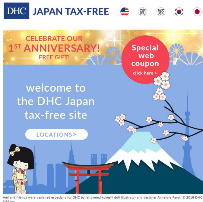
DHC 訪日観光客向け情報サイト 「DHC JAPAN TAX-FREE」 トップページ

株式会社ディーエイチシー（本社：東京都港区、代表取締役会長 兼CEO：吉田 嘉明、以下：DHC）は、2018年12月18日（火）より、訪日観光客向け情報サイト「DHC JAPAN TAX-FREE」開設1周年プレゼントキャンペーンを実施いたします。「DHC JAPAN TAX-FREE」サイトからプレゼントクーポンをダウンロードしてご持参いただいたお客様に、DHCオリジナルマグカップをプレゼント。（※各店舗先着30名様。なくなり次第終了。キャンペーン対象店舗のみ。）